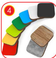
Seitenwände und Plattformen bestehen aus 13 mm starkem HPL Verbundstoff (schwarze Platten 8mm) in Ralfarben und sind absolut Witterungsbeständig.