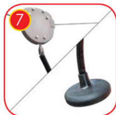
Edelstahlaufkatze mit Bremse. Sitz aus weichem Gummi, mit einer Verstärkung aus Stahl, an einer Kette mit einem Schlauchüberzug.