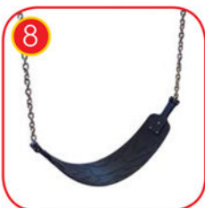
Schaukelriemensitz aus Gummi mit Textileinlage mit 6mm Edelstahlketten.