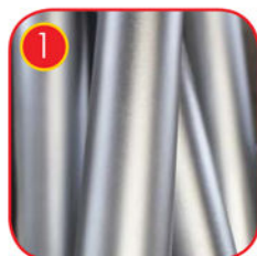
V2A Edelstahlposten AISI 304