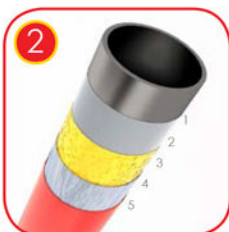
Verzinkte Stahlposten mit farbiger Pulverbeschichtung nach RAL QUALICOAT zertifiziert 1 Stahl 2 Sandstrahlung 3 Eisenphosphat 4 Verzinkung 5 Polyesterpulverbeschichtung