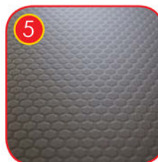
Plattformplatte mit spezieller rutschhemmender Beschichtung aus HPL. Materialstärke: 10mm Farbe: Anthrazit