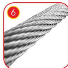
Verzinktes Seil aus geflochtenem Stahldraht. Ø 10 mm