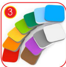
Seitenwände bestehen aus dreischichtigem, farbigem HDPE Kunststoff in höchster Qualität und sind absolut Witterungsbeständig. Materialstärke 15mm Farbgebung nach RAL